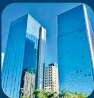
Filial Porto Alegre- RS (Rua Manoelito de Ornellas, 55, sala 2201)