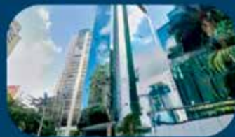
Filial São Paulo/SP (Rua Funchal, 263, sala 92 - Vila Olímpia)