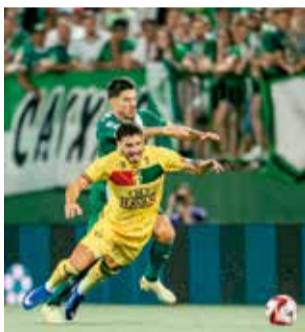
Chapecoense reverte a vantagem e está na final do Catarinense

O Verdão busca seu oitavo título estadual — o mais recente conquistado em 2020.