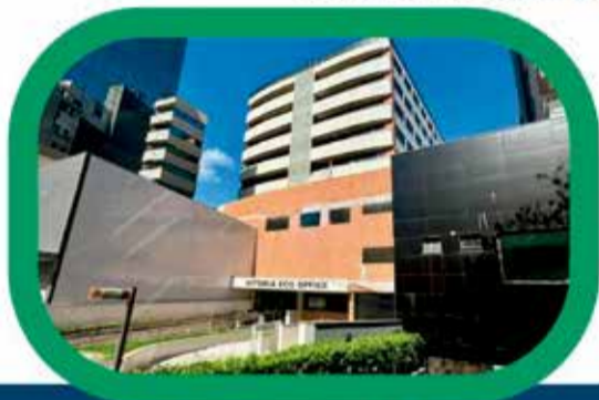
Sede Florianópolis-SC (Rua Patrício Farias, 55, sala 509)