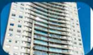
Filial Caxias do Sul -RS (abrangendo 140 municípios) (Av. Independência, 2432, sala 24/4º Andar)