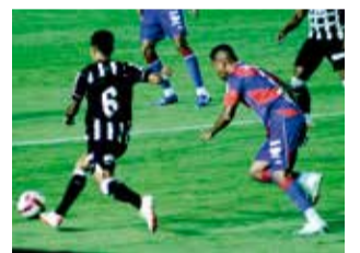
Figueirense perde para o Marcílio Dias e está perto do rebaixamento

Com o resultado, o Furacão fica em situação delicada e praticamente encaminha sua queda para a Série B do Catarinense. Já o Marinho se aproxima da permanência na elite estadual.