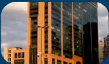
Filial Rio de Janeiro-RJ (Avenida Rio Branco, 01, sala 1607, Centro)