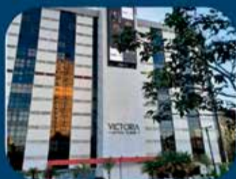
Filial Brasília -DF Setor Saus Quadra 4, s/n Asa Sul, bloco A, Sala 513/Parte 506