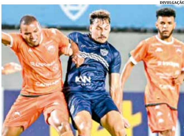
Barra goleia e está pela primeira vez na final do Catarinense

O Pescador enfrentará a Chapecoense, que venceu o Brusque no último domingo e também avançou à decisão. Já o Camboriú, por sua vez, volta suas atenções para a busca de uma vaga na Copa do Brasil do próximo ano. O compromisso será diante do Avaí, pela Taça Acesc, em jogo marcado para o estádio Orlando Scarpelli.